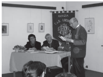
Presentazione del volume Lucinis, Štandrež, Podgora. Repertorio microtoponomastico elaborato dagli atti catastali .