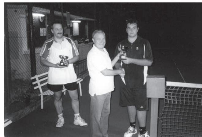
Foto di gruppo dei partecipanti ai corsi di tennis. In basso le premiazioni a conclusione dei tornei.