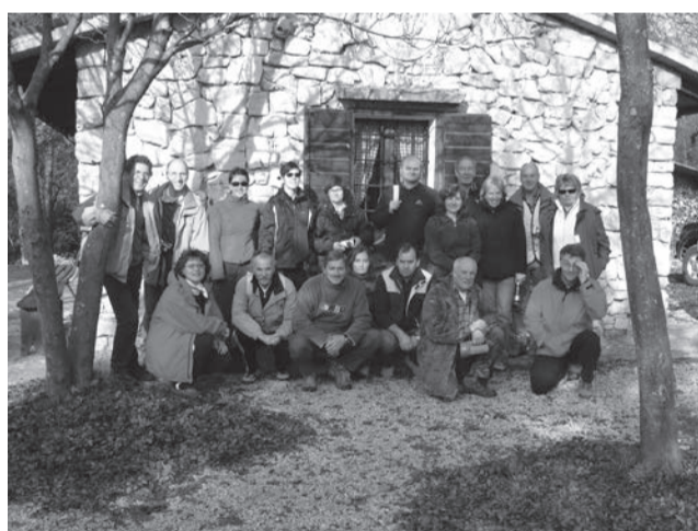
Nella sede delle "Talpe del Carso" a San Michele