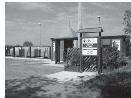
Nel 2005 è entrata in funzione l'isola ecologica per la raccolta differenziata

manutenzione del fabbricato, completamente fatiscente, comprese la parte destinata ai loculi coperti e la Cappella del Santo Spirito. È altresì necessario il completamento del piazzale esterno destinato a parcheggio.