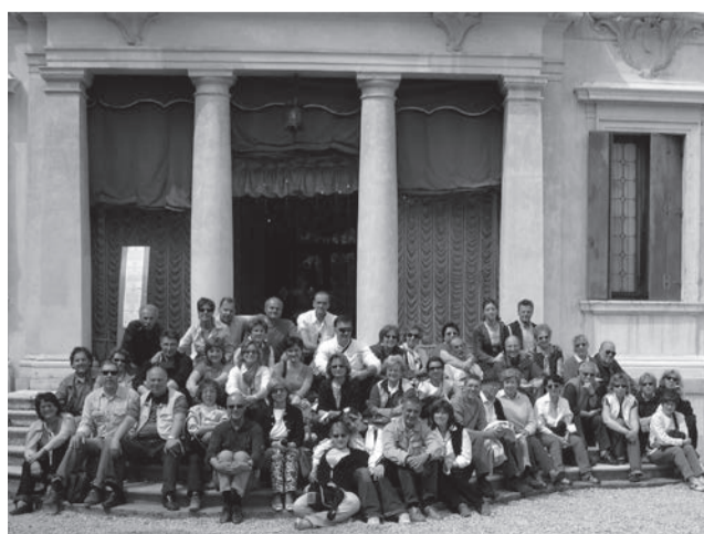
Davanti a villa Widman