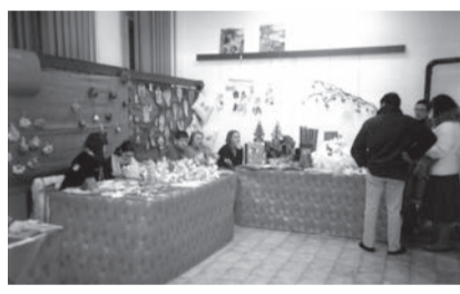
Mercatino di Natale: particolare dell'allestimento e, in basso, alcuni espositori.