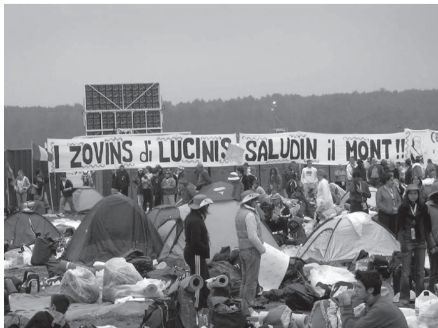
Lo striscione che i "zovins di Lucinis" hanno esposto a Marienfeld e, in alto, il gruppo di Lucinico