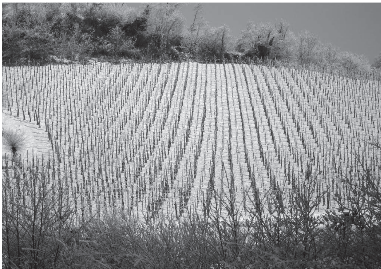
Vigna innevata nei dintorni di Lucinico