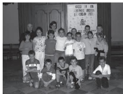
I bambini della prima S. Confessione.