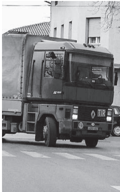
Il traffico pesante che transita nel centro del paese e soprattutto lungo la via Visini è una questione irrisolta.

Rispetto alle richieste del 2004, nulla è stato fatto per risolvere il problema del traffico veicolare leggero e pesante sulla strada statale 56 che continua a creare gravi disagi. Il 24 settembre scorso, il Consiglio di quartiere ha inviato una lettera alle Amministrazioni comunali di Gorizia e Mossa ed alla Provincia di Gorizia, con la richiesta di un incontro congiunto per essere informati sulle difficoltà persistenti nella realizzazione del progetto. Ancor oggi il Consiglio si deve accontentare di leggere sulla stampa locale le notizie riguardanti la realizzazione della variante alla SS 56.