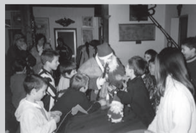
A sinistra: Babbo Natale porta i doni ai piccoli calciatori.