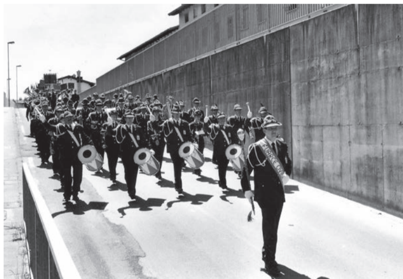
La banda alpina di Orzano a Lucinico in occasione del gemellaggio con il paese austriaco di Altlichtenwarth. Il gruppo dei partecipanti della gita a Misurina.

Originali alcune iniziative, come la Festa delle ciliegie e la Festa della patata, con esposizione di frutti e tuberi e degustazione di specialità gastronomiche.