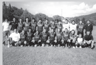
Formazioni del Lucinico 2005-2006.