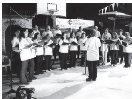
Sagra di S. Rocco: le premiazioni della tradizionale tombola e l'esibizione della Coral di Lucinis