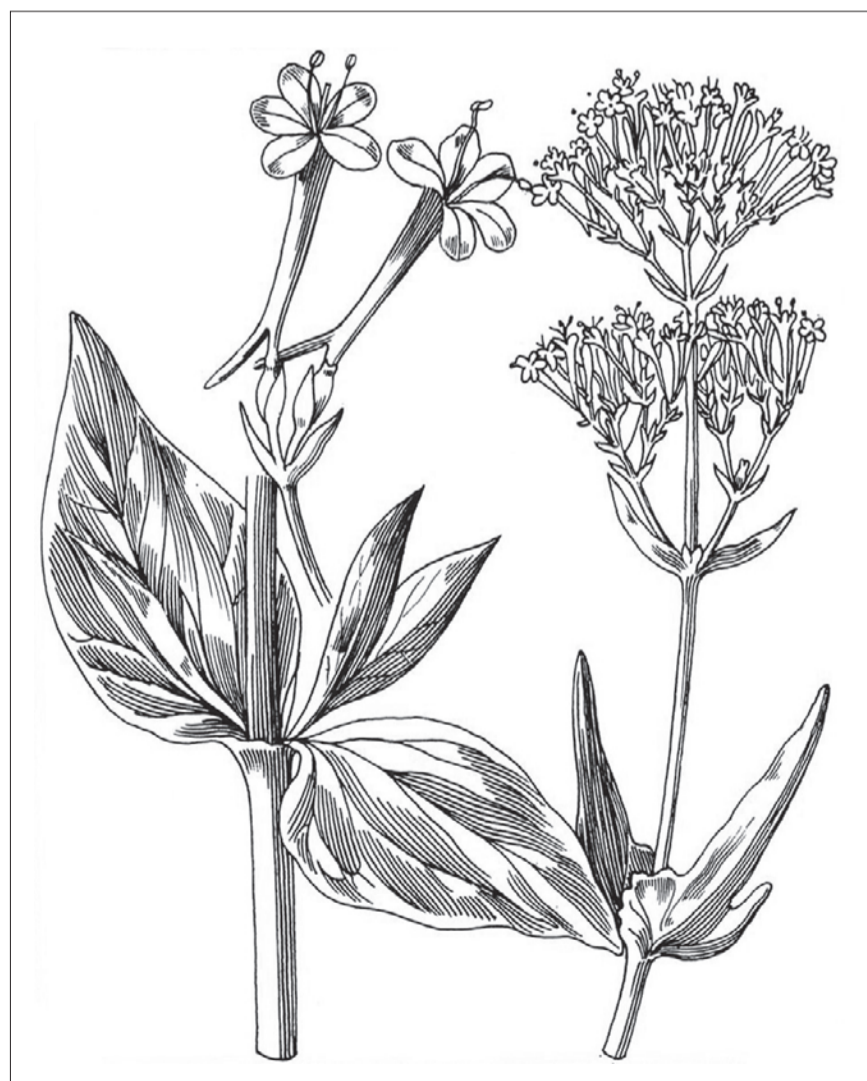
La valeriana e (in alto nella pagina) la malva rappresentate negli erbari tradizionali