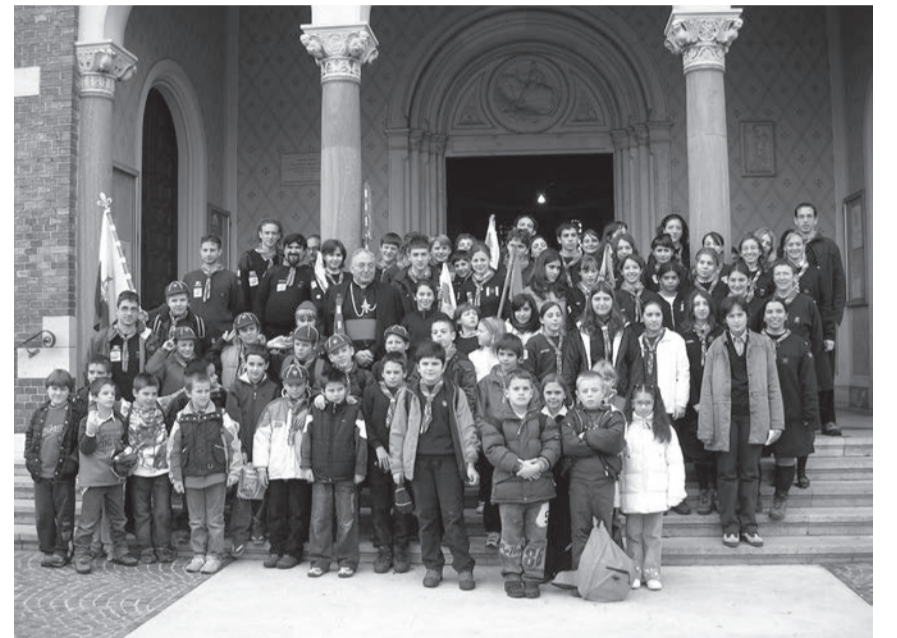
Foto di gruppo con l'Arcivescovo Mons. Dino De Antoni in occasione dei festeggiamenti per i dieci anni di scoutismo a Lucinico.

L'ambiente dello scoutismo è quello messo a disposizione di tutti: l'aria aperta, la felicità, l'essere utili agli altri.