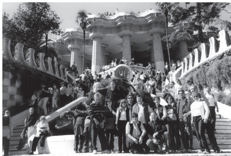
Premiazione dei giovani campioni dello Sci Club "Monte Calvario". In basso il gruppo dei partecipanti al viaggio a Barcellona