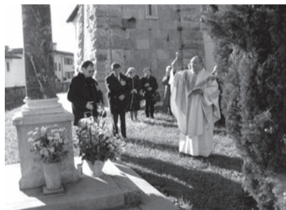
Tradizionale omaggio floreale alla statua dell'Immacolata l'8 dicembre.