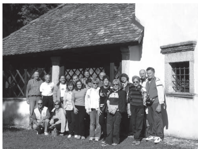
Al Santuario della Madonna di Raveo