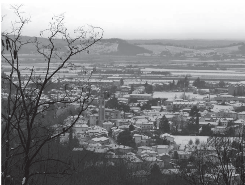
Vista di Lucinico sotto la neve

miazione degli ottantenni che hanno svolto attività agricole, commerciali ed artigiane.