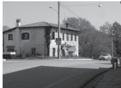
Il pericoloso incrocio sulla Mochetta attende ancora il promesso semaforo.

Non ci sono commenti: l'installazione dell'impianto semaforico all'incrocio delle vie Mochetta, Campagna Bassa, Stradone della Mainizza doveva essere funzionante già da mesi, ma, per l'indempienza della ditta incaricata, la Grove Elettrica di Codroipo, il processo d'installazione procede a singhiozzo.