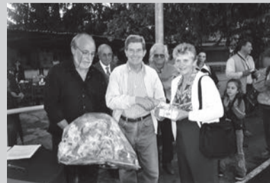
Due momenti delle premiazioni a conclusione del 3° Memorial Eugenio Trampus, compianto dirigente dell'ASC Lucinico, che per anni ha contribuito alla crescita della società. Sempre presente, ha seguito con passione ogni momento della vita dell'associazione, dimostrandosi particolarmente attento ai giovani.