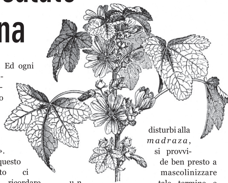
disturbi alla madraza , si provvide ben presto a mascolinizzare tale termine e si parlò del modron , la stessa malattia che in Lombardia veniva detta magone .

Siccome anche l'uomo va soggetto a disturbi nervosi ed addominali simili a quelli della donna, e non era possibile attribuire tali