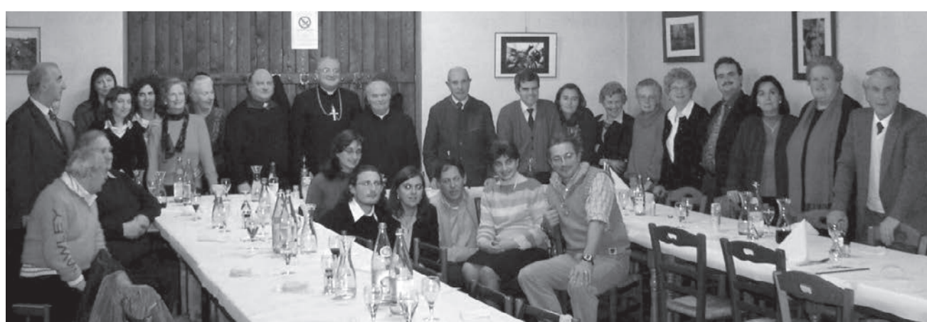
Diversi momenti della visita pastorale dell'arcivescovo Dino De Antoni a Lucinico.