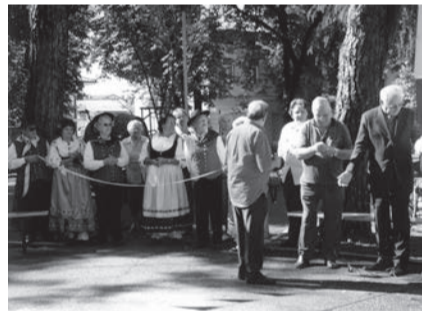
La festa dell'uva nel Prat