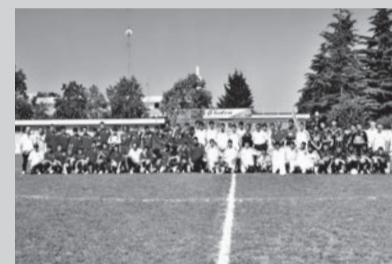
A destra: nel 2005 il Lucinico (primo a destra) ha partecipato al Torneo UNICEF con il Monfalcone (ospitante), Staranzano e Ronchi.