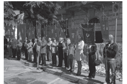
L'ADVS festeggia la XXXIV Giornata del donatore.