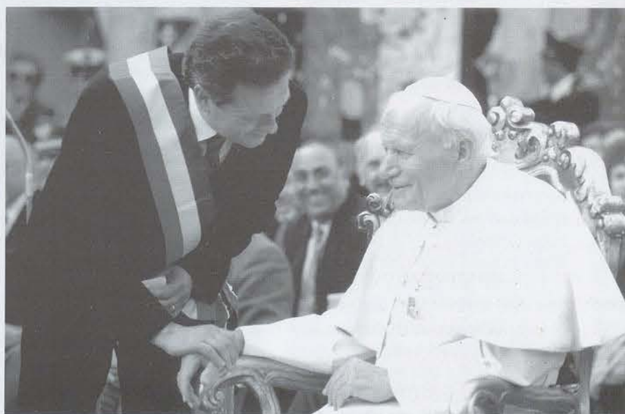
Il Sindaco di Gorizia, Erminio Tuzzi ex fortissimo difensore della squadra di Lucinico, saluta il Papa, Giovanni Paolo II, venuto in visita apostolica alla Diocesi e alla città isontina il 2 maggio 1992

altri componenti: Claudio Miclausig. (realizzerà alcune reti determinanti per il successo finale) Allenatore: Armando Trentin.