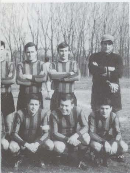
vincitrice del campionato provinciale "H" 1968/69