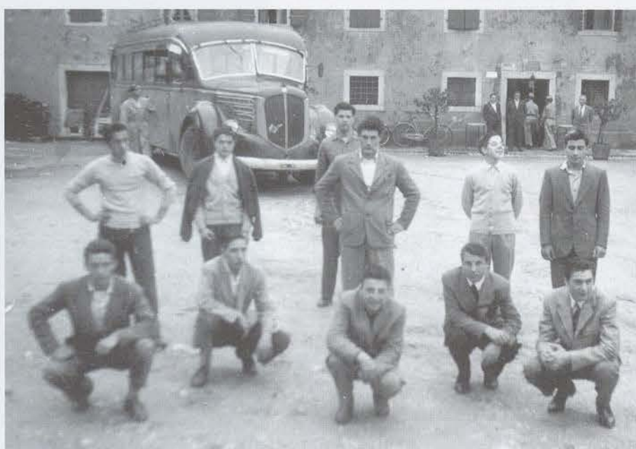
la squadra campione regionale juniores 1953-54