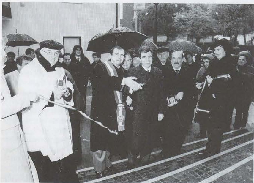
Inaugurazione dell'agenzia di Cormons domenica 21 novembre 1999.

Gli ultimi mesi del 1999 sono stati importanti per la Cassa rurale ed artigiana di Lucinico. Tra novembre e dicembre si sono succedute le aperture delle nuove sedi di Cormons e di Mariano. Le inaugurazioni, che si sono svolte in concomitanza con le rispettive tradizionali feste del Ringraziamento, hanno voluto sottolineare la vocazione della Cassa ad essere presente nei momenti importanti di aggregazione di una comunità.