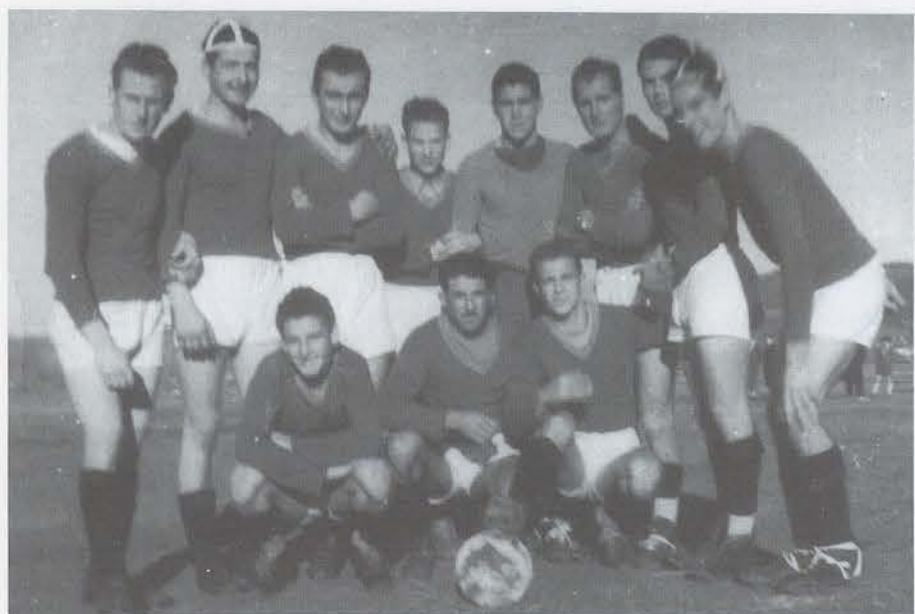
ecco la forte squadra dell'U.S. Lucinico che partecipo' al campionato "sezione propaganda" del 1945/46