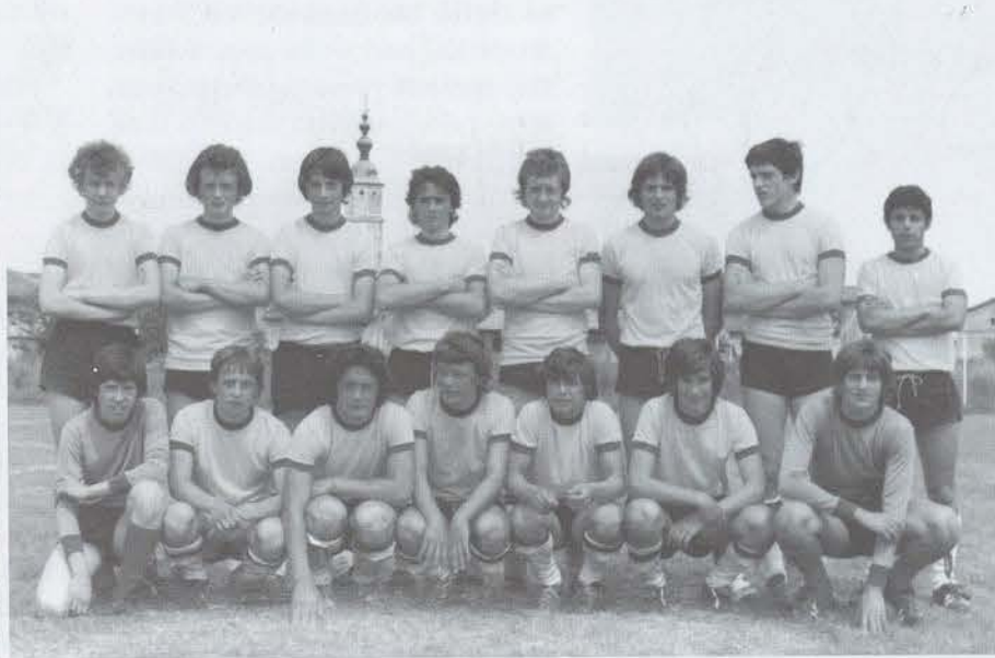
la squadra vincitrice del campionato provinciale "Allievi" 1974/75