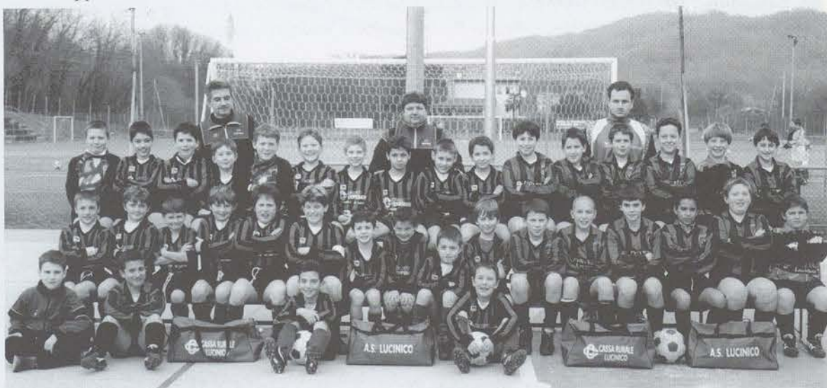
Bambini e ragazzi categorie Primi Calci e Pulcini (classi 1989, 1990, 1991, 1992, 1993) stagione sportiva 1999/2000

Dopo la gara Ponziana - Lucinico del 3 ottobre 1982